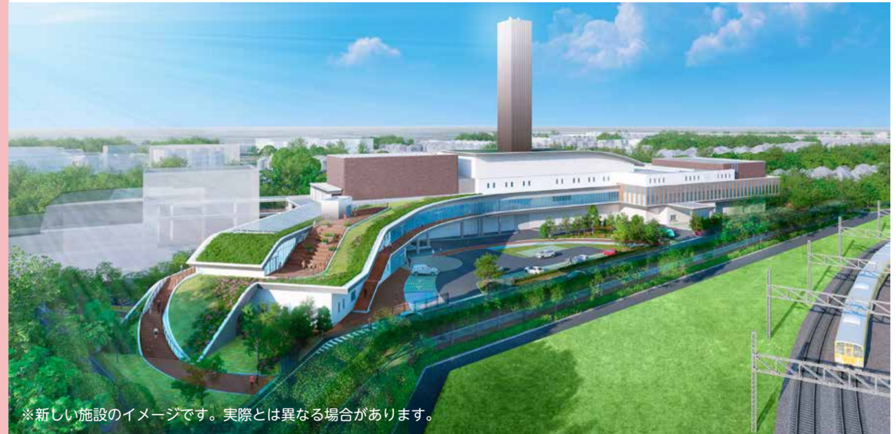
※新しい施設のイメージです。実際とは異なる場合があります。