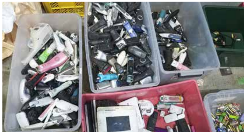
●電池が残っている小型家電類