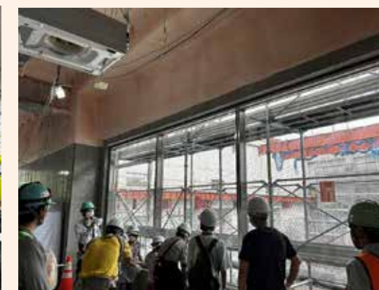
ごみピットの見学