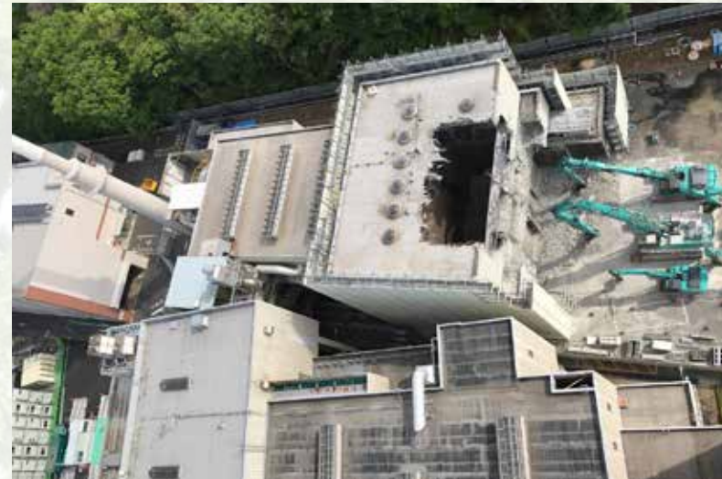
令和3年4月中旬 3号ごみ焼却施設の解体の様子

新しいごみ焼却施設の整備は、令和2年7月の旧粗大ごみ処理施設の解体からスタートしました。その後、3号ごみ焼却施設の解体を経て、現在に至ります。