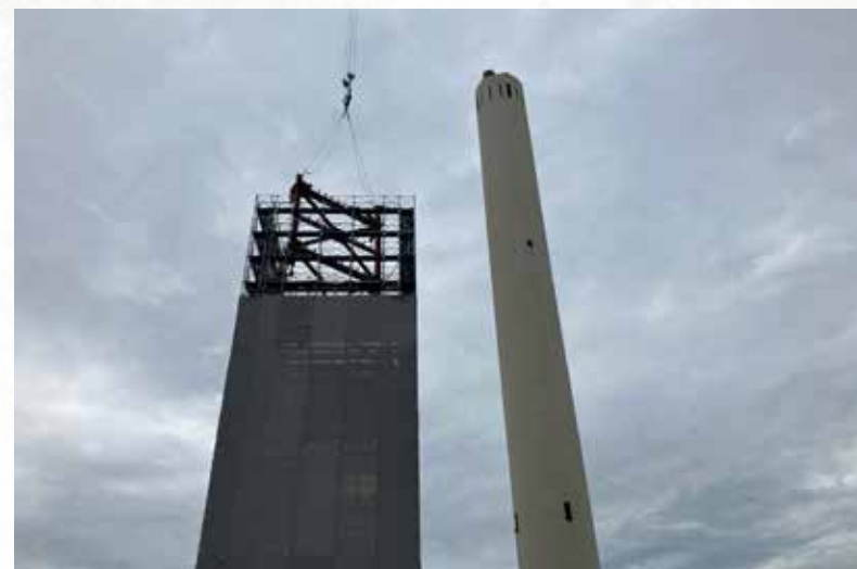
令和6年7月 新しいごみ焼却施設の煙突の鉄骨組立の様子