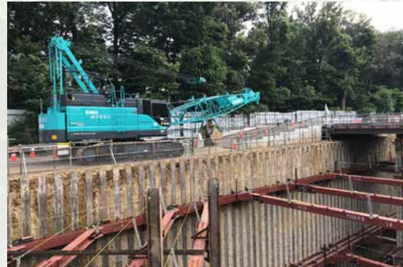
令和4年6月中旬 新しいごみ焼却施設の地下掘削工事の様子