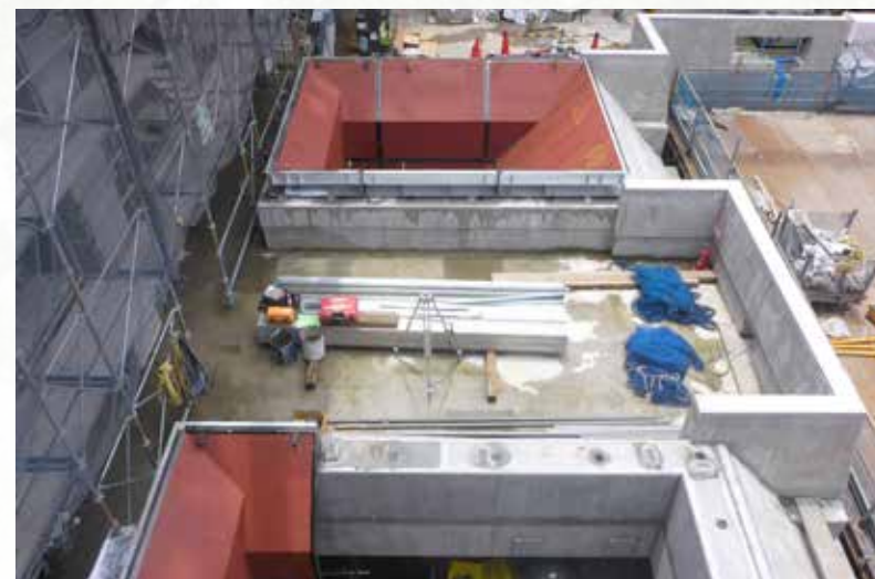
令和6年7月 新しいごみ焼却施設の焼却炉へのごみ投入口の様子