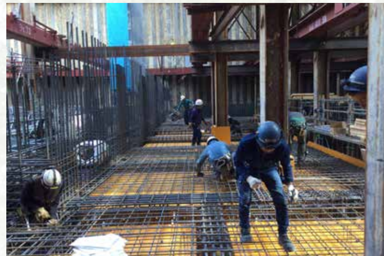
令和5年4月 新しいごみ焼却施設の鉄筋組立の様子