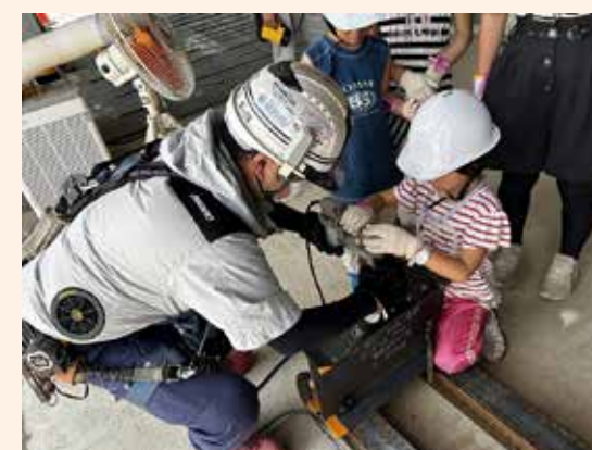
作業体験コーナー (ボルト締め)